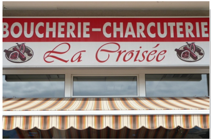
BOUCHERIE LA CROISÉE